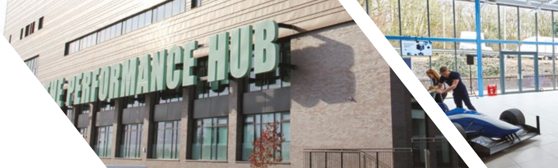
▲ 沃尔索尔校区表演中心

我们最近还向特尔福德校区投资了1000万英镑，用于许多专业领域的先进新工程设施和设备采购，包括赛车工程设备。