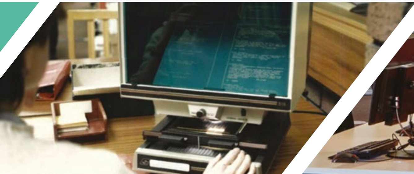
▼ 缩微平片上的信息搜索