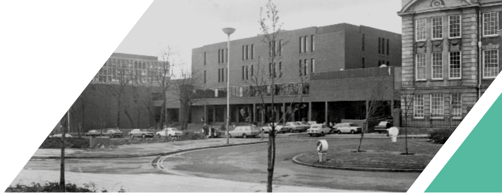
▲ 胡弗汉顿市中心校园，前安比卡保罗大楼 (pre-Ambika Paul Building)

胡弗汉顿大学 (1992年至今) 1992年，胡弗汉顿理工大学获得大学办学资格，并更名为胡弗汉顿大学。如今，我们继续投资于我们的学生、教职员工、校友以及本地和国际社区，每年有4000多名学生毕业。