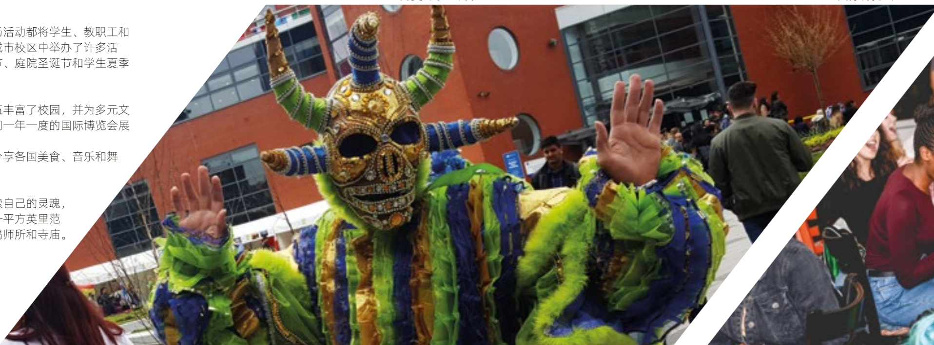
舞者享受庭院庆祝活动 ▼