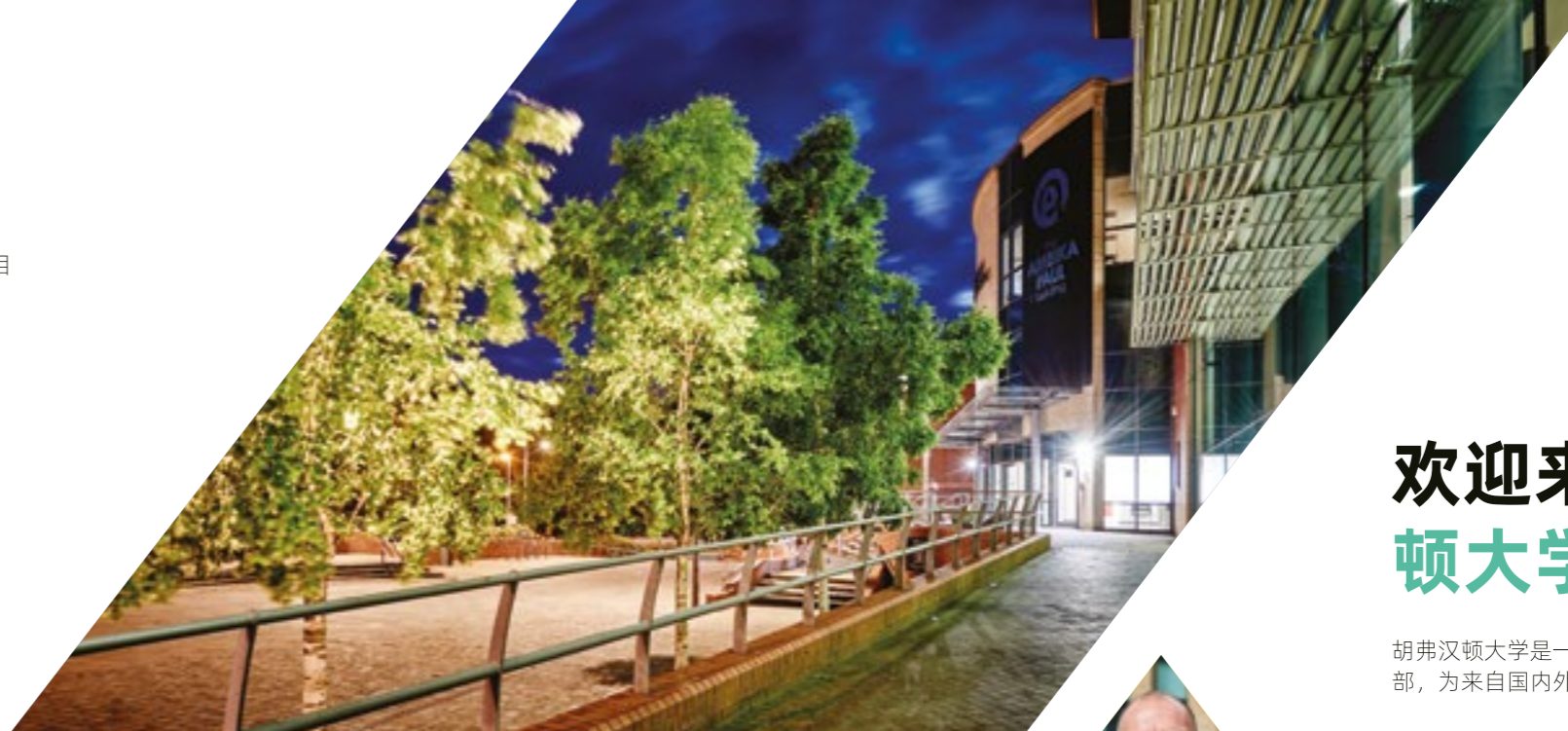
▼ 胡弗汉顿城市校区的学生