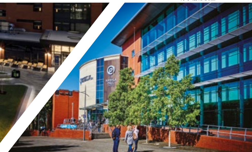
▼ 勋爵史劳杰·保罗大楼，城市校区